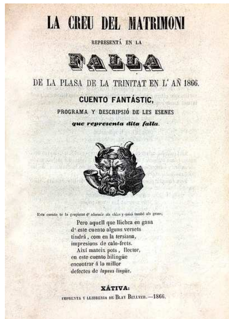
La creu del matrimoni (segona portada)