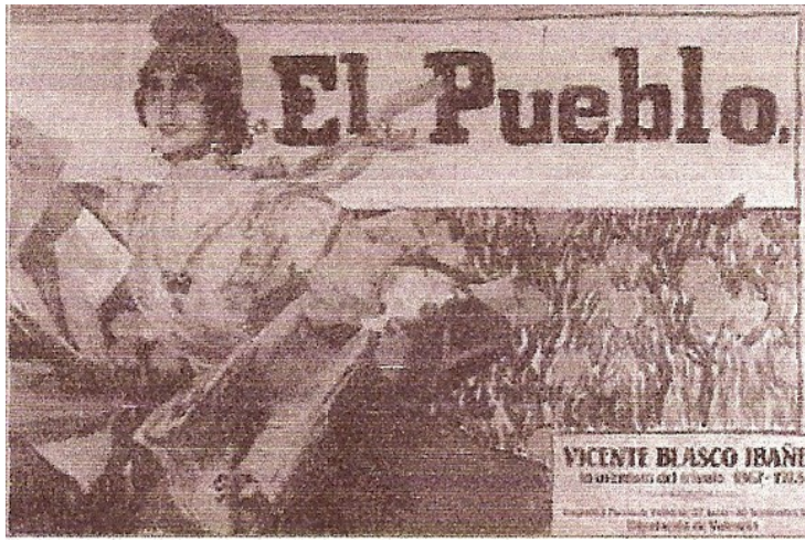
Capçalera del diari El Pueblo , original de Joaquim Sorolla