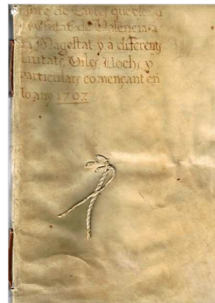
Portada del volum "Lletres missives" (AHMV), que conté el Memorial de Blanquer i Ortí.