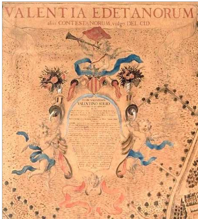
Cartela barroca, coronada en l'escut de València, situada en l'angul superior esquerre del pla, en la que s'inclouen notícies sobre l'història de València. Pla de València, 1704