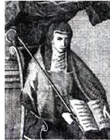
Sor Isabel de Villena