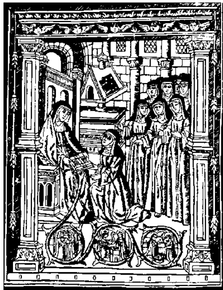
Vita Christi , Cap. CXCVII Valencia, 1497