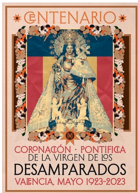
CARTELL DEL CENTENARI DE LA CORONACIO. VERSIO ACTUALISADA DE L'OBRA ORIGINAL, DE 1923, DE VICENT CANET.

No son estos els unics projectes en els que s'ha embarcat el Rogle, puix nos agradaria en breu poder posar a l'abast del public dos edicions, una sobre la lliteratura poetica dedicada a la Mare de Deu dels Desamparats i l'atra uns retalls sobre les festes de la coronacio de 1923 i la corona poetica que el Rogle, gracies a la concurrencia i col·laboracio de mes de 25 poetes, ha pogut confeccionar.