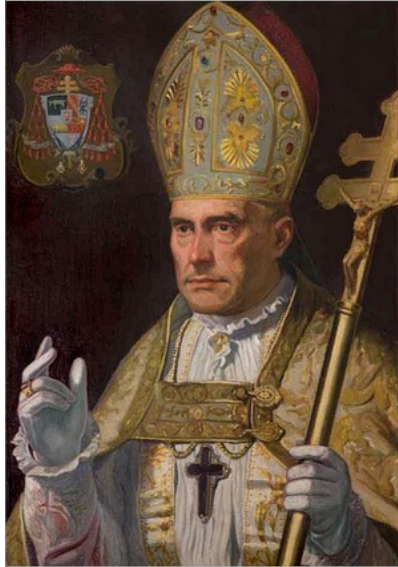
ENRIC REIG I CASANOVA

Una informacio no massa coneguda, es la de que l'acte estava programat per a la festa de la Patrona en el mes maig de 1924. El nomenament que se produi d'Enric Reig com a nou arquebisbe de Toledo i Cardenal Primat d'Espanya per Pio XI , el 11 de decembre de 1922, i l'obligatorietat d'incorporar-se al nou carrec en un temps determinat, feu que esta celebracio s'haguera d'alvançar un any per a que el seu principal promotor poguera estar present i celebrar l'acte.