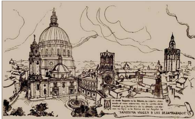
PROYECTE D'AMPLIACIO DE LA BASILICA, DE VICENT TRAVER I TOMÁS, 1932

La frontera principal, que dona a la plaça, conta en dos portes d'acces bessones flanquejades per columnes i entaulaments d'orde toscà en fronto partit, el timpan del qual se decora en relleu de la Confraria. Una tercera porta modificada en forma de finestral, situada a l'extrem esquerre, fon cegada en el segle XX. A finals del segle XVIII l'arquitecte Vicent Gascó Masot afegí a la frontera principal cinc pilastres concebudes segons el conegut com a "orde jagant" –com en l'interior– que centren els vans de les portades i dels balcones i subrallen els contorns estructurals dels extrems.