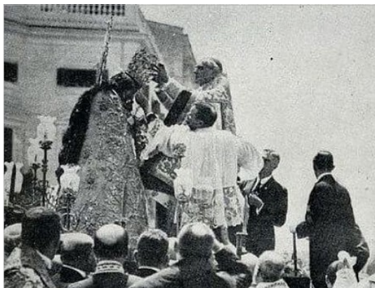
EL CARDENAL REIG CORONANT A LA MARE DE DEU DELS DESAMPARATS

carrer el prelat estigue present. En la Guerra Civil se tornà de nou a nomenar carrer Avellanes. En l'actualitat, qui fora arquebisbe de Valencia te dedicada una via important en la zona de Transits de la ciutat de Valencia: l'avinguda Primat Reig .