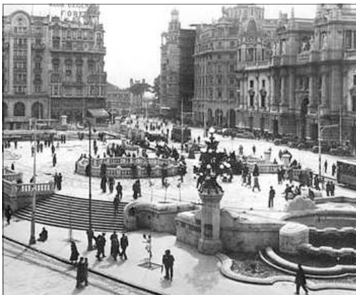
"TORTADA DE GOERLICH"

El seu treball i la seua popularitat feu que ocupara la presidencia o be la direccio de diferents institucions artistiques, acadèmiques i culturals.