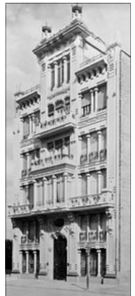
EDIFICI BARONA (GRAN VIA MARQUES DEL TURIA, 70. VALENCIA C.)