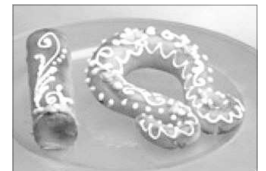
PIULETA I TRONADOR

La Processó Civica es l'acte central de la festa, pero no l'únic. Des dels inicis, entorn al 9 d'Octubre s'han celebrat festejos diversos: balls, espectacles, teatre, disfrazos...; i en