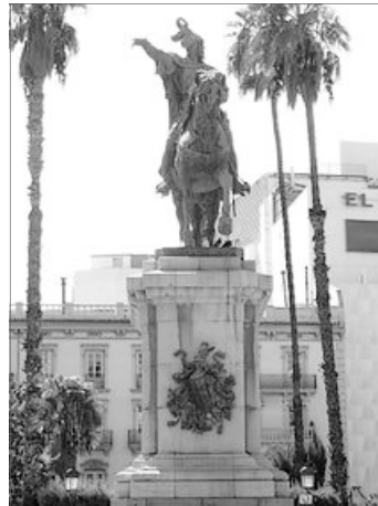
MONUMENT A JAUME I. VALENCIA CIUTAT

En 1838 se celebra de nou en tota solemnitat. En 1891 s'inaugura l'estatua de Jaume I, que se convertirà en el futur en el centre de la festa. Lo Rat Penat començarà a fer una processó al monument en la seua senyera. La jornada va incrementant el seu caràcter més reivindicatiu i la participació va sent mes nutrida. En