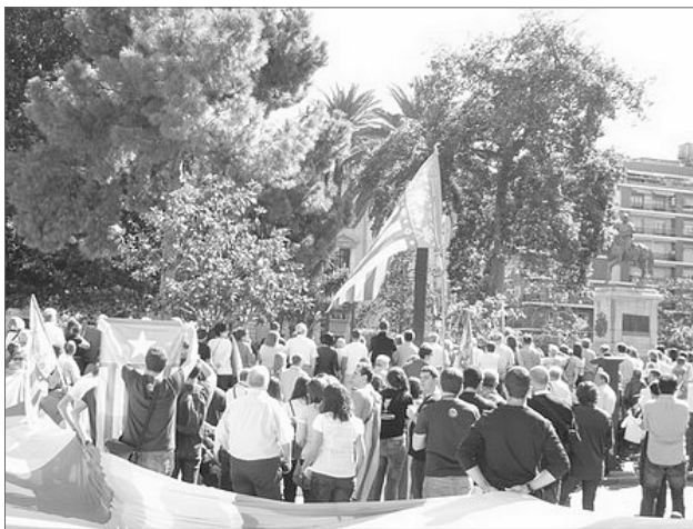
EL 9 D'OCTUBRE, VALENCIANS I VALENCIANISTES

Efectivament, el mateix nom de la festivitat coincidix en el dia que es celebra. I si això es aixina es, precisament, perquè es lo que han volgut des del principi els responsables polítics. La festivitat té un altre nom: Dia Nacional Valencià . Els representants polítics podien, ¡deven!, haver insistit en esta segona denominació fins a convertir-la en el nom oficial i habitual, deixant com a secundari, com a subtítol, el de 9 d'Octubre . Però ha segut justament al contrari, lo que han procurat es eliminar qualsevol referència " nacional valenciana " que impliqui una carrega reivindicativa que detesten i deixar la festa en una manifestació descafeïnada, un recòrt històric de velles glories passades; i, si no fora per la participació activa i emocionada de la gent (la que no se mostra en Canal 9 ), ya l'hagueren convertida en una festeta de carrer més. I precisament es perquè aixina es com la consideren, que no s'ho han pensat dos voltes a l'hora de propondre translladar-la al dilluns.