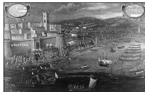
EMBARCAMENT DE MORISCOS EN EL GRAU DE VINAROS

El desenroll d'este succés se va produir paulatinament en diferents etapes, zones i anys , finalisant en l'expulsió dels moriscs de Castella l'any 1614. Se començà, per a donar eixemple, pel Regne de Valencia, lloc en el qual la població morisca era major (33%), aixina puix el dia 22 de setembre de 1609 se va publicar en el Cap i Casal el Bando de l'expulsió , en el qual se donaria principi ad esta accidentada i desafortunada deportació. En els primers mesos de 1610 se realisà l'expulsió dels moriscs aragonesos i en setembre del mateix any la dels catalans.