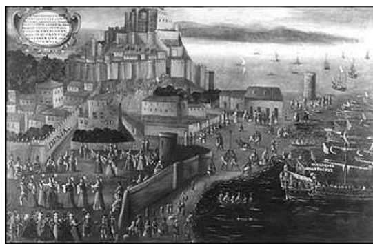
EMBARCAMENT DE MORISCOS EN EL GRAU DE DENIA

La política a propòsit de la població morisca fins a 1608 havia segut la de la conversió , encara que en anterioritat Carles I (1526) i Felip II (1582) havien formulat la possibilitat de prendre una mida mes radical. Fon a partir de l'any 1608 quan el Consell d'Estat , comprovant el creiximent de la població morisca, començaria a plantejar-se l'opció de l'expulsió dels denominats nous cristians . Felip III , debil monarca en mans del seu codiciós ministre el Duc de Lerma , al qual havia entregat el govern de la Corona, i influït tambe pel seu confessor fra Gaspar de Cordova , junt en els requeriments rebuts per part dels estaments eclesiàstics promulgà el decret d'expulsió dels moriscs, baix pena de mort, en el qual se'ls acusava d'apostates, hereges i traïdors, i que significaria l'exodo massiu dels descendents dels musulmans convertits, que se venen obligats a abandonar els bens que posseïen per a ser embarcats i traslladats a territoris nort-africans.