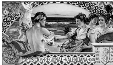
CARTELL DE L'EXPOSICIO

El recinte de l'exposició el formaven, junt en la fira comercial, un centre d'exposicions d'art, un parc d'atraccions, palau de congressos, auditori de música, palau de l'òpera, casino de joc, estadi deportiu, museu de les ciències i la tècnica i, com a colofó, el Pabelló Municipal , centre d'exposicions de productes de tot el territori peninsular. L'esclat de la guerra del Riff , junt en unes atres