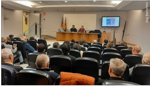
VISTA DE LA SALA

Organisat pel Rogle Constanti Llombart , el passat 14 de desembre tingue lloc la presentacio de dos llibres, u dels quals incrementa la serie La Veu del Rogle , en este cas en el volum 4, i l'atre correspon a l'edicio Orgull del nostre poble, mare i sol de Valencia , del qual es autor el nostre president. Els dos publicats per l'editorial Mosseguello .