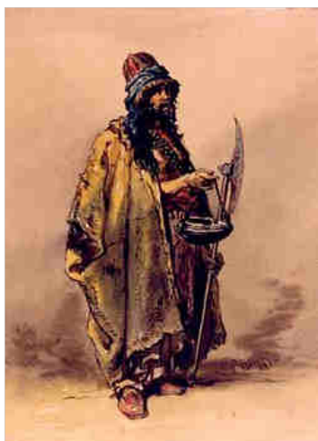
DERVIX OTOMA, D'AMEDEO PREZIOSI, c1860s.

vix . Aixina, el sobira decidi recordar sempre el consell i ordenà que fora escrit en les parets en lletres d'or, inclus gravat en la seua vaixela de plata.