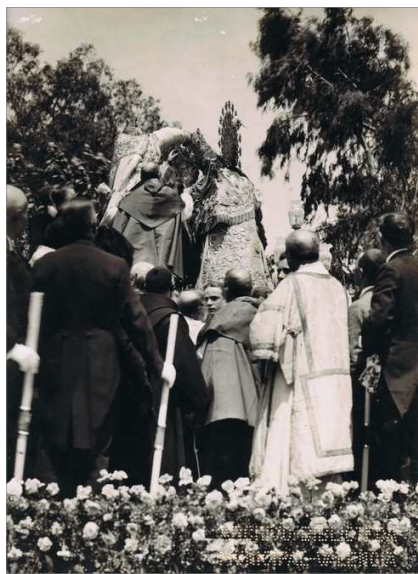
MOMENT DE LA CORONACIÓ

baixava, sobre una font de plata, la Corona . Baix una pluja de flors arribà l'imatge al lloc a on se celebraria la cerimònia, allí fou depositada sobre la tribuna construïda a propòsit; al costat, a la dreta, en una altra esperaven els reis Alfons XIII i Victoria Eugènia , el corteig i també el nunci de Sa Santitat, els bisbes i les primeres autoritats municipals i de la Diputació .