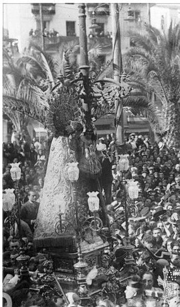
LA MULTITUD AL PAS DE LA MARE DE DEU CAMI DE LA CORONACIÓ