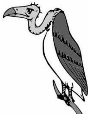
PAPER DE LA AVL EN ESTA HISTORIA

El decà de la RACV havia iniciat conversacions en el president de la AVL i pareix que havien acordat la redaccio del document aludit, el qual marcava les bases per a la col·laboracio entre estos dos organismes. Vist aixina, res cabria objectar i entraria dins de la normalitat el que dos institucions iniciaren un proces de col·laboracio en benefici de la societat a la que se deuen. Pero el fet es que, de partida, se pretenia que la RACV assumira l’autoritat normativa de la AVL, lo qual es tant com dir llevar tota autoritat a la Seccio de Llengua i Lliteratura ; i este es el problema, porque, com tot lo mon hauria de saber ya, la AVL es un organisme naixcut del secretisme politic per a suplantat la llengua valenciana i, de manera emmaixquerada, actuar de sucursal del Institut d’Estudis Catalans en l’objectiu de fer confluir la llengua valenciana en el catala, per a lo qual no dubten en denigrar les seues formes singulars i propies desderrant-les com a formes coloquials, indignes d’un llenguatge cult, reservant este espai per al catala.