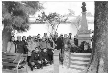
ALGUNOS DELS ASSISTENTS EN LA FOTO DE GRUP

Esta es la primera d'algunes actuacions que, en motiu d'este 125 aniversari, te programades el Rogle i de les quals donarém puntual informació en este bolleti.