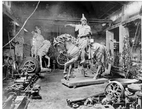
ESTATUA EN ELS TALLERS DE LA MAQUINISTA VALENCIANA