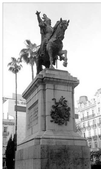
MONUMENT EN EL PARTERRE