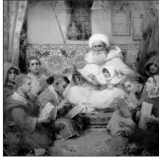
EL MESTRE ARAP, DE BENLLIURE

En el cas dels mes menuts fa de capità un major.