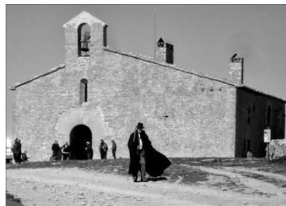
SANT PERE DE CASTELLFORT

Esta es una pelegrinació mes de les que es fan en les terres de les comarques de mes al nord del Regne de València, en les que encara es guarda i professa una religiositat molt arrelada, constituint a l'hora un ric patrimoni cultural.