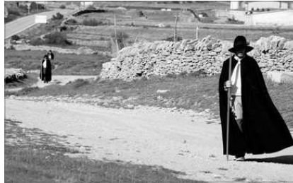
PELEGRINS CAMI DE L'ERMITA

toritats eclesiàstiques i civils, eixiran de la Iglesia Parroquial de l'Assuncio per a recórrer un camí no apte per a vehiculs d'uns 15 quilometres fins l'ermita romànica de Sant Pere de Castellfort. Ixen u a u, a cada toc de campana i sense parlar, començant pel mes major i separats per una distància de cinquanta passos entre ells; l'últim porta una campana que servix d'avis per als demes. Inicien el " camí dels Pelegrins ", que