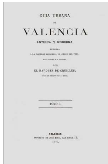
GUIA URBANA DE VALENCIA ANTIGUA Y MODERNA, MARQUES DE CRUILLES

entrete la concurrència que es numerosa, atreta per la curiositat; fins els balcons de les cases circumveïnes s'adornen en teles penjades, i per lo regular des d'un d'ells se veu estesa una corda de focs artificials per a cremar la falla, i els arbres de foc que tambe la circumden, formant un conjunt d'animació i d'algassara, nomes comprensible en esta ciutat.