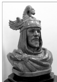
REI EN JAUME I, F. SERRA ANDRÉS

El nostre patrimoni històric i ordenava, de manera especial cultural es ric i ha segut confor-