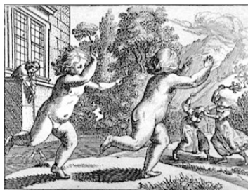
IL·L·U·S·T·R·A·C·I·O· DE CONRAD MEYER, DEL LLIBRE KINDERSPIEL (JOCS DE CHIQUETS)

S'acaba la tanda quan tots estan dins del quadro i paga -aço es, amagarà la correja- el primer que entrà en la "casa". Aixina torna a escomençar el joc.