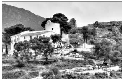
ERMITA DE LA MAGDALENA I, DARRERE, LES RECIALLS DEL CASTELL

A lo llarc del primer semestre d'enguany s'han vingut organisant unes jornades per a posar en valor este enclau arquitectònic, el qual podra ser visitat en un futur proxí.