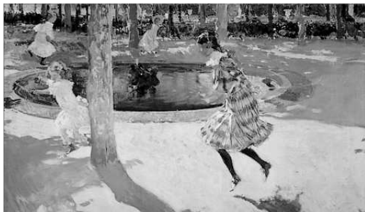
BOTANT A LA CORDA. LA GRANJA, JOAQUIM SOROLLA

El o la que "pagava" es ficava en el mig del rogle i