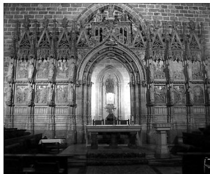
CAPELLA DEL SANT CALIX. SEU DE VALENCIA

En el Rogle 27, de desembre de 2008, l'article "El Sant Calix" explica l'història sencera d'esta relíquia des del Sant Sopar fins a l'actualitat.