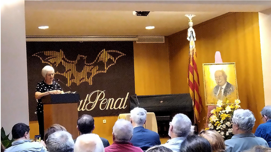
Instantànea del saló Constantí Llobart en el moment del discurs d'homenage el 7 de juny de 2025.

Discurs pronunciat el dia 7 de juny de 2024 en motiu del sentit homenage que Lo Rat Penat i associacions valencianistes dedicaren a l'extraordinari poeta i compromés valencianiste Anfós Ramon i García, en motiu de celebrar-se el centenari del seu naiximent.