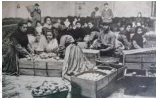
Triant i encaixant taronja