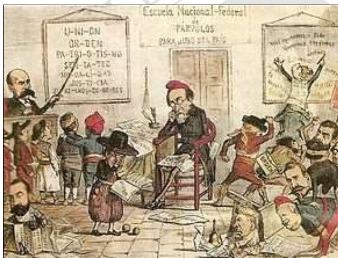
Caricatura de la revista satírica La Flaca en la que apareix Pi i Margall desbordat pel federalisme, representat per figures infantils vestides en els diferents trages regionals.

El seu pensament es podia resumir en: un desig d'expansió i millora de Castello, creixement i transformació de l'economia castellanenca (millorar la producció agrària, construcció del port, adequar les infraestructures, creació de la Cambra de Comerç), afrontar una reforma social en una millora de l'ensenyança per a lo qual feia falta la construcció i millora de col·legis i millorar la preparació del professorat, i la difusió dels ideals valencianistes i defensa de la llengua valenciana.