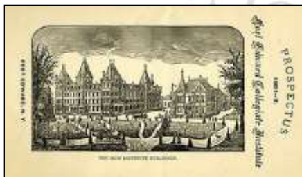
Image del Fort Edward's Institut de Nova York

En la divisio territorial de l'any 1833 Castello es convertix en capital de provincia i passa de ser una poblacio menuda a una vila gran. La seua economia agraria tenia com a maxim exponent el conreu del canem per a l'elaboracio de corda i espartenyeria, per la qual cosa es produi un gran canvi a finals del segle XIX en l'introduccio del taronger, cultiu que guanyaria rapidament terreny de l'horta al canem, mentres que l'arros s'estenia per la marjal, i la vinya i la garrofera ho feyen pel secà. Esta alternativa agro-mercantil comportaria el