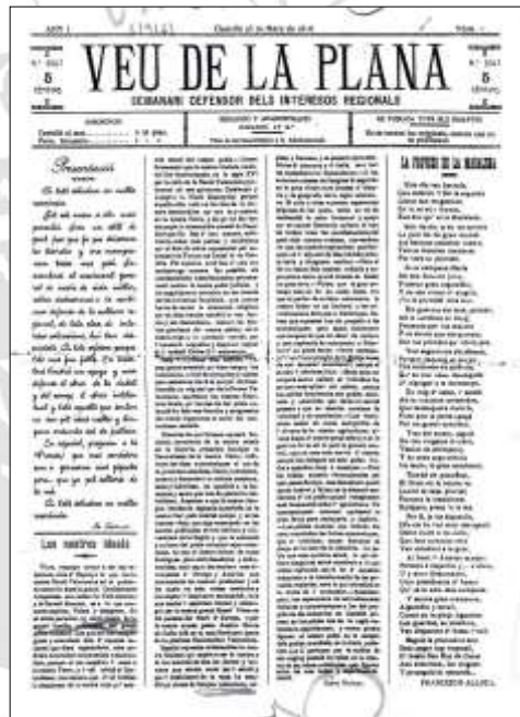
“Los nostres ideals” en la Veü de la Plana