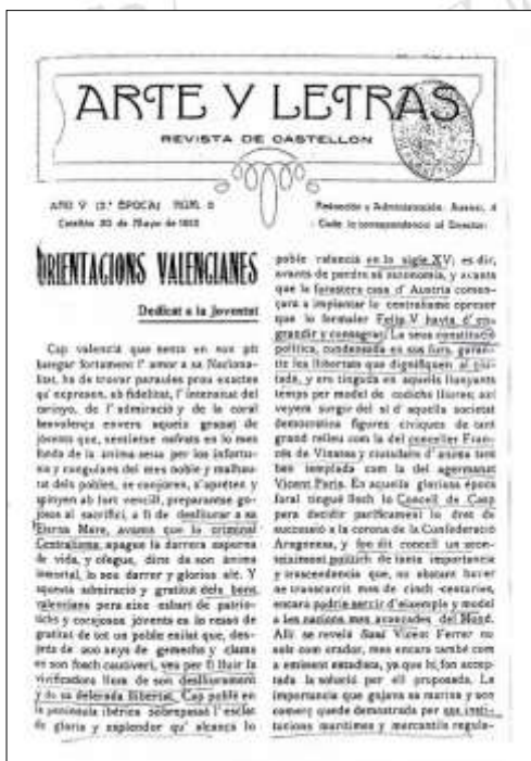
Publicacio de "Orientacions valencianes. Dedicat a la Joventut", en Arte y Letras

En Arte y Letras (nº 6, 1915) i en l'articul titulat "Orientacions valencianes. Dedicat a la Joventut", diu: