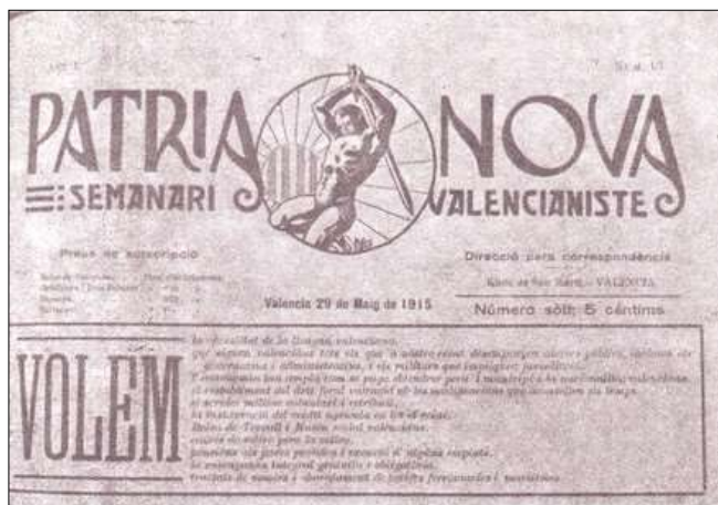
Capçalera del semanari Patria Nova

A la mort de Constanti Llobart, Castello es posa de dol, per respecte a qui se sabia que era intim amic de Gaetà Huguet, puix ya llavors este castellanenc era una de les persones mes ilustres, respectades i volgudes de la ciutat. Els titulars dels diaris d'aquells dies feen referencia a la mort del patriarca de les lletres valencianes i fundador de Lo Rat Penat. Es celebraren certamens i actes en homenage a Constanti, impulsats pel seu amic.